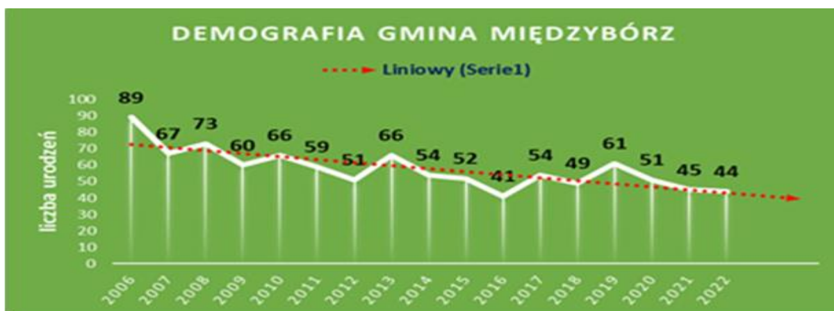
Wykres 2. Liczba urodzeń w Gminie Międzybórz w latach 2006-2022.

Źródło: Urząd Miasta i Gminy w Międzybórz – Wydział Edukacji, Kultury i Spraw Społecznych.