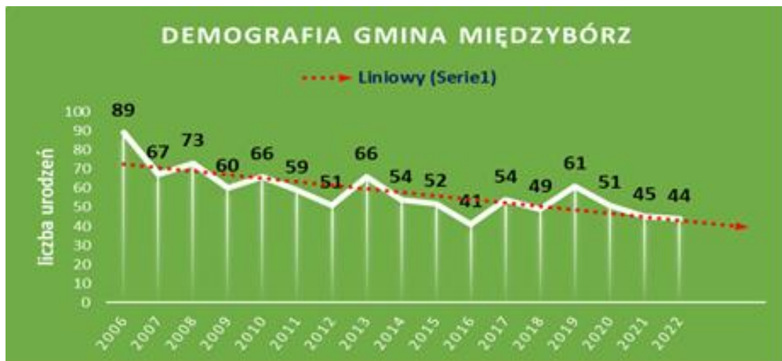
Tabela 28. Liczba urodzeń w Gminie Międzybórz w latach 2006-2022.

Dodatkowym czynnikiem jest niepewność dotycząca przepisów oświatowych, które ulegają częstej zmianie oraz widoczne na rynku pracy braki w kadrze pedagogicznej zwłaszcza wśród nauczycieli przedmiotów ścisłych takich jak fizyka, chemia, matematyka, czy też języka polskiego. Duży nacisk kładziony także jest przez ministerstwo na zatrudnienie nauczycieli specjalistów w zakresie pomocy psychologiczno-pedagogicznej. Deficyt na rynku w tym zakresie powodował będzie dodatkowe problemy we właściwej realizacji podstawy programowej lub zaleceń kuratorium oświaty, a także konsekwencje finansowe dla gmin.